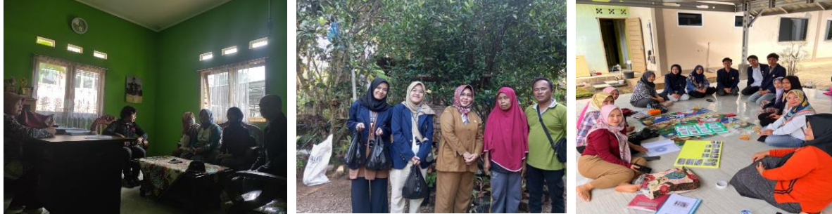
Gambar 2 Wawancara dan Diskusi dengan Kepala Desa, Ibu PKK dan masyarakat