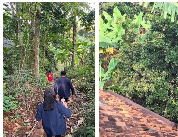
Gambar 1. Dokumentasi Survei Lahan Petani Ubi dan Jagung sebagai Sarana Pendataan.

Kegiatan pengabdian kepada masyarakat pada tahap persiapan dilakukan dengan melakukan observasi lapangan terkait tanaman buah yang banyak di tanam penduduk untuk di jual dengan melakukan melihat dan mengunjungi petani di lokasi kegiatan pengabdian.