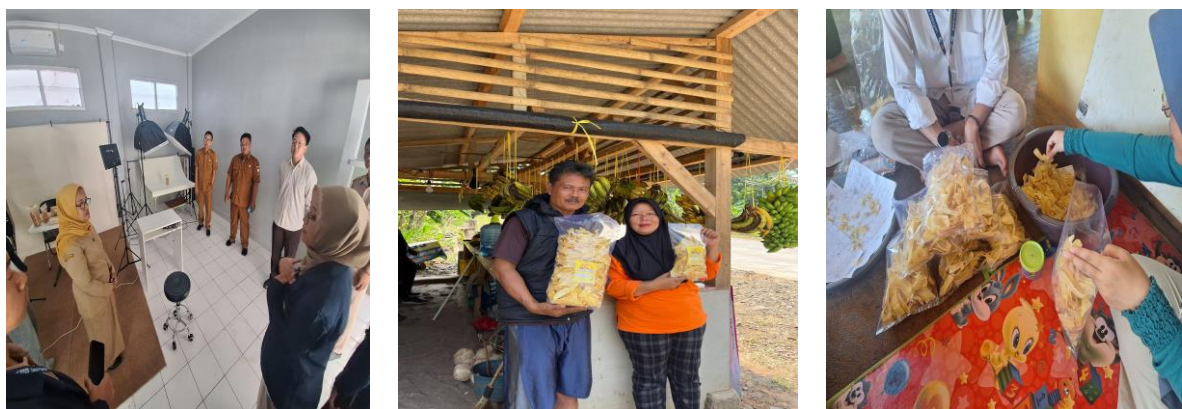
Gambar 5. Desain kemasan sederhana produk olahan buah Desa Pajagan.

olahan buah sawo yang dapat dilihat pada Gambar 4, Fasilitasi informasi desain kemasan gratis dari rumah kemasan Kabupaten Sumedang untuk semua pelaku UMKM di Kabupaten Sumedang dapat dilihat pada Gambar 5.