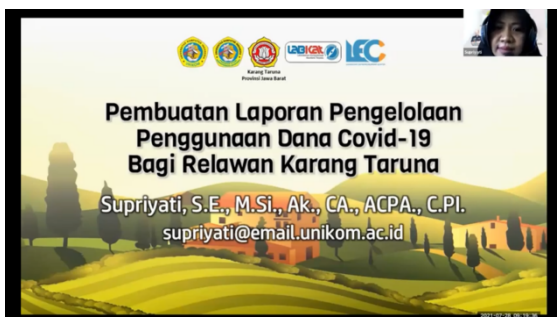
Gambar 2. Penyampaian Materi Pembuatan Laporan Pengelolaan Penggunaan Dana Covid-19 Bagi Relawan Karang Taruna - Supriyati, S.E., M.Si., Ak., CA., ACPA., C.PI.

Berdasarkan kuesioner pasca kegiatan yang diisi oleh pengurus/anggota Karang Taruna maupun teman sejawat pemerhati Karang Taruna bahwa kegiatan Pengabdian pada Masyarakat ini perlu terus dilakukan secara rutin dan mereka merasa senang dalam meng- update ilmu-ilmu baru. Dalam Pelaksanaan PPM ini juga kami dari tim pelaksana sudah membuat Grup WhatsApp khusus sebagai media untuk diskusi dan komunikasi yang sampai sekarang masih aktif dalam pertukaran informasi-informasi kebaikan dan media komunikasi antar pengurus anggota Karang Taruna yang mengikuti kegiatan PPM. Kami harap bahwa silaturahmi ini akan terus terjalin dan dapat lebih banyak bergabung