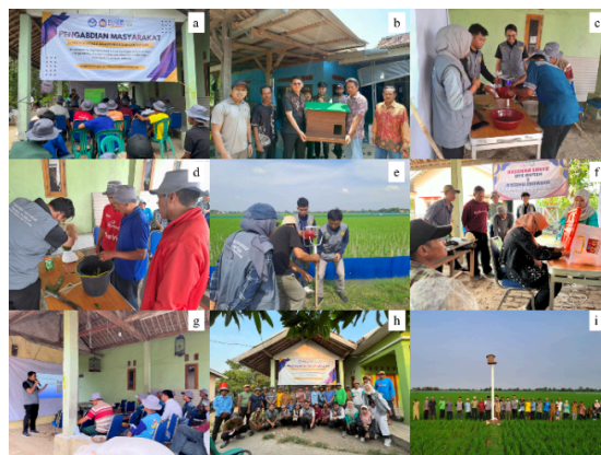
Gambar 1. Kegiatan FFS: (a) Pemberian Materi, (b) Penyerahan Rumah Burung Hantu, (c) Perakitan Perangkat Lampu, (d) Pembuatan Pestisida Nabati, (e) Pemasangan Perangkat Lampu pada Lahan Sawah, (f) Perbanyakkan Massal Jamur Entomopatogen, (g) Evaluasi Kegiatan, (h) Foto Bersama Petani Mitra, (i) Monitoring Rumah Burung Hantu

Monitoring dan evaluasi keberhasilan kegiatan dilakukan dengan mengukur aspek peningkatan pengetahuan dan keterampilan petani pada setiap agenda kurikulum melalui kuesioner sebelum dan sesudah ( pre-test dan post-test ). Kuesioner disusun atas beberapa pertanyaan dalam skala Likert 1–4 (tidak tahu, kurang tahu, tahu, sangat tahu). Data yang diperoleh dikumpulkan pada perangkat lunak Microsoft Excel , kemudian data dianalisis dengan t-Test Paired Two Sample for Means dengan tingkat kepercayaan 95% atau alpha 0,05 menggunakan Analysis ToolPak pada Microsoft Excel . Jika nilai signifikansi P ( T \leq t ) two-tail < 0,05 maka agenda kurikulum yang diberikan dalam FFS berpengaruh signifikan terhadap peningkatan pengetahuan dan keterampilan petani.