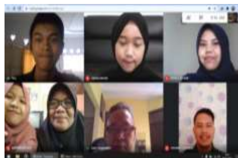
Gambar 4. Konsultasi dengan Ketua RW

Tahapan-5 : Testing , hasil pembuatan dicobakan di internet kemudian meminta tanggapan dari RW yang dilakukan lewat zoom seperti pada Gambar 4. Tanggapan dari RW menyambut dengan baik dan merasa dibantu untuk tugas-tugas yang akan datang karena informasinya ada di website. Misalnya template-template surat yang sudah tersedia di web menjadikan warga dapat mengakses langsung kemudian mengisi datanya. Hal ini mempermudah dan menghindari kontak langsung ke rumah RW dalam menjaga pandemi Covid 19.