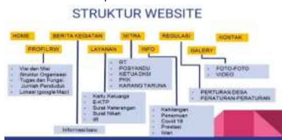
Gambar 2. hasil rancangan struktur website

Tahapan-3: Design , hasil rancangan struktur website yang bagus untuk informasi RW berdasarkan penelusuran website RW di internet terlihat pada Gambar 2.