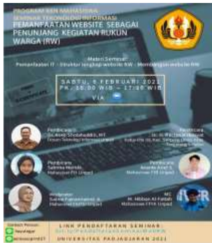
Gambar 5. Poster Webinar

Pada kegiatan webinar dengan nara sumber dari pembuat website , perwakilan ketua RW dan Pembimbing KKN. Salah satu capture dari kegiatan zoom terlihat pada Gambar 6.