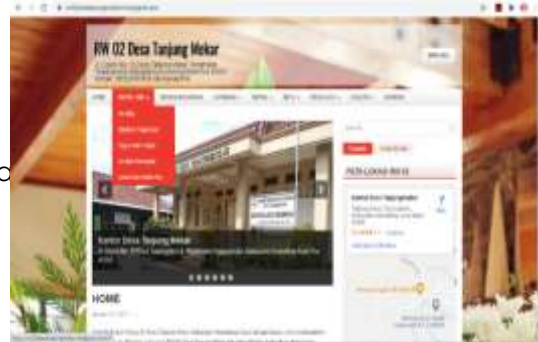
Gambar 3. Hasil pembuatan Website RW 02

Tahapan-4: Coding , tahapan ini adalah membuat website RW Hasil pembuatan website RW 02.