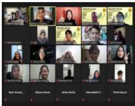
Gambar 6. Kegiatan Webinar

Pada kegiatan webinar dengan nara sumber dari pembuat website , perwakilan ketua RW dan Pembimbing KKN. Salah satu capture dari kegiatan zoom terlihat pada Gambar 6.